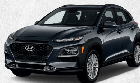
Hyundai Kona Y17/MY20