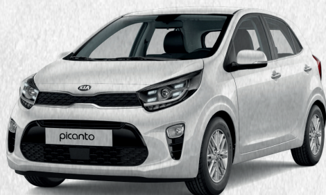
KIA Picanto MY17/MY20