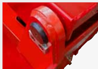
Funkcje produkcyjne dla najbardziej obciążonych obszarów