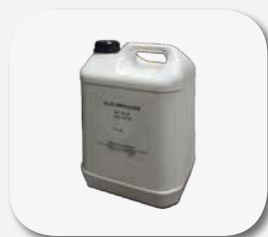
Wlew oleju 17 litrów