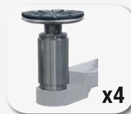
Zestaw przedłużeń do podnośników 100 mm (4 pcs)