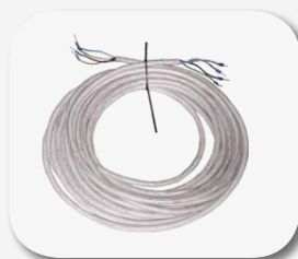
Zestaw kabli 10 m