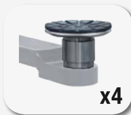
Zestaw przedłużeń do podnośników 50 mm (4 pcs)