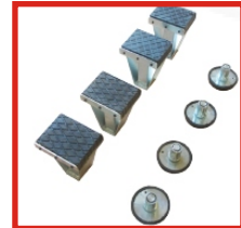
Zestaw 4 przedłużek do podstawek kod. 8-43300021