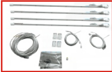
Zestaw oświetleniowy kod. 8-42120003